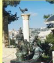
St. Peter's Gallicantu

All Inclusive Package Flight Ticket, Entrance Fees, Breakfast, Lunch, Dinner, Nile Cruise, Boat Ride, Superior Hotels, Professional Guide,